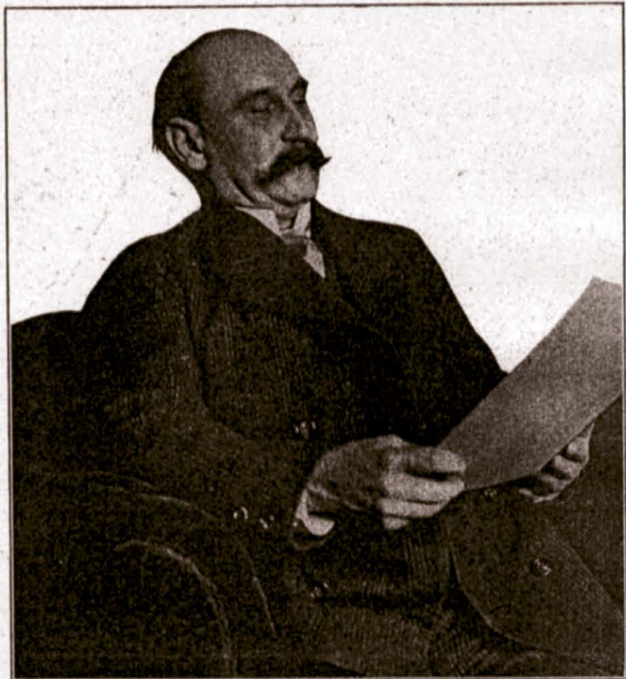
Xaver Scharwenka, the Distinguished German Pianist Now in America

"I am told much about a correct 'method.' There is no one such; there are merely methodical ways of doing things.