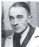
Richard Scheibe. Bildhauer