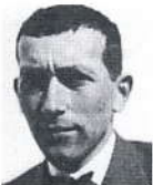
Marcel Breuer. Architekt