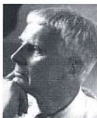
Gerhard Marcks. Bildhauer