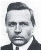
Adolf Meyer. Architekt