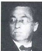
Wassily Kandinsky. Maler