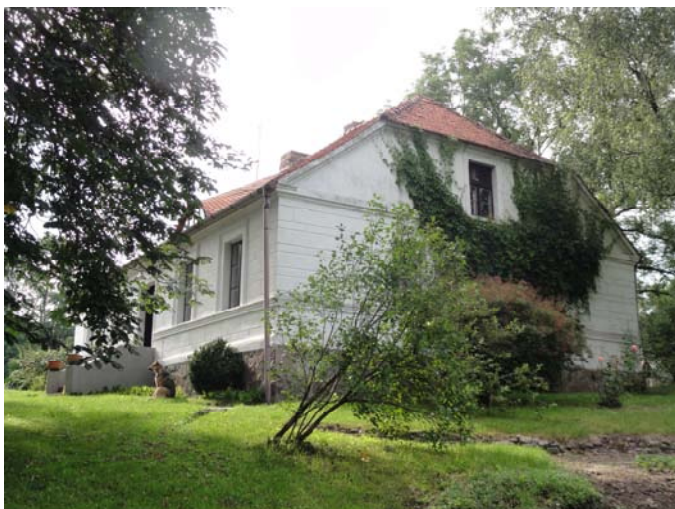
Bilder vom heutigen Gut Ruks