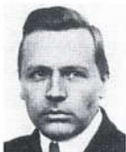
Adolf Meyer. Architekt