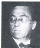
Wassily Kandinsky. Maler