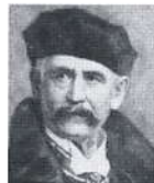
Xaver Scharwenka. Komponist