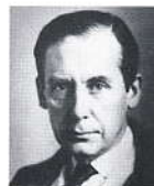
Walter Gropius. Architekt