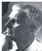
Gerhard Marcks. Bildhauer