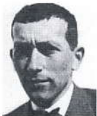
Marcel Breuer. Architekt