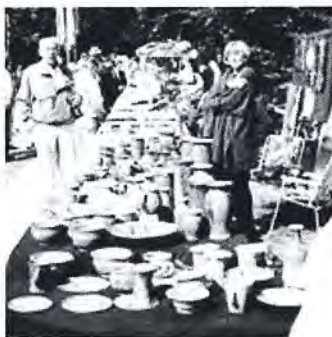
Der Kunstmarkt ist einer der Höhepunkte des Kultursommers 2010.