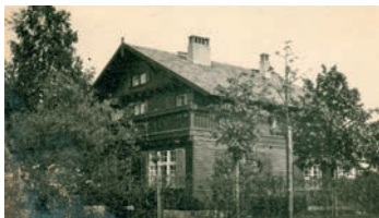
„Haus Poka“, Postkarte ca. 1915