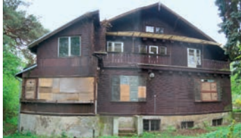
Nordfassade 2009 vor der Rekonstruktion