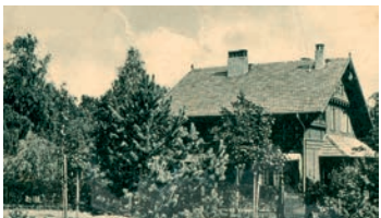
„Haus Prof. Scharwenka“, Postkarte ca. 1912