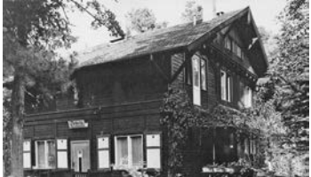
„Peters Weinstuben“, Postkarte ca. 1975