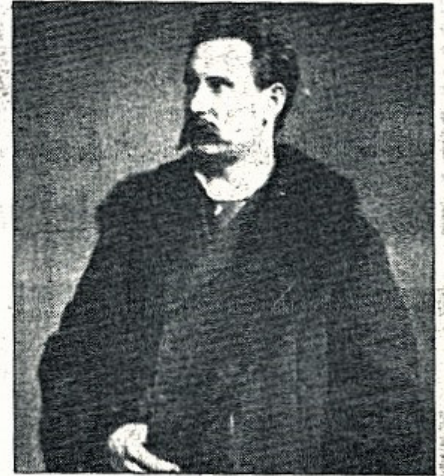
Komponist Philipp Scharwenka (1847-1917)